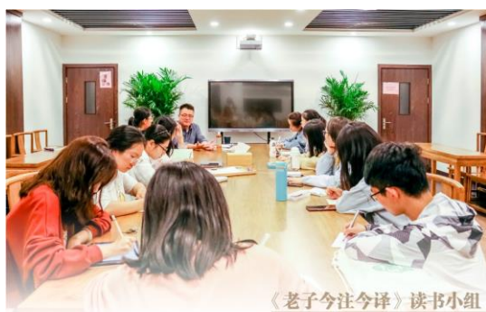
《老子今注今译》读书小组