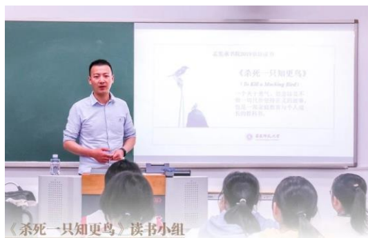
《杀死一只知更鸟》读书小组